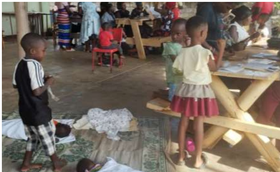
Tienermoeders skills, het project bij MCAFS in 2024

Tenslotte gaat MCAFS een kredietsysteem beheren waar de jongeren een kleine lening aan kunnen gaan om essentieel handgereedschap aan te schaffen.