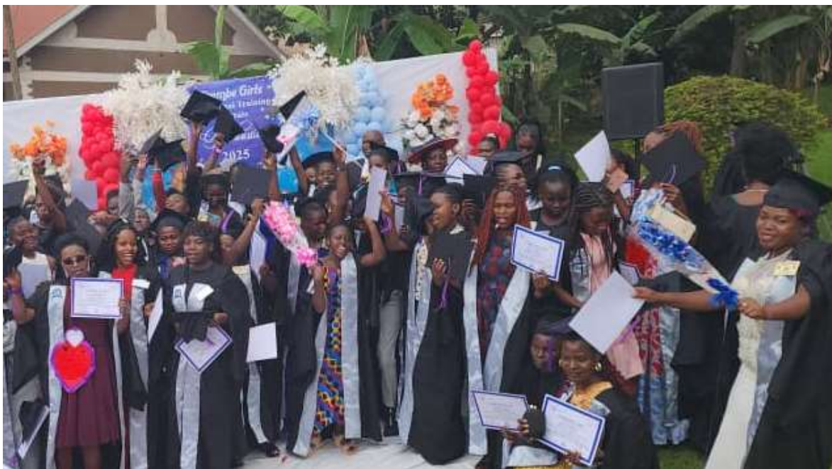
Diploma uitreiking van de opleiding interieurverzorging en decoratie waar een groeiende markt voor is

In Zana staat een prachtig opleidingscentrum waar meiden niet naartoe zouden kunnen bij gebrek aan schoolgeld.